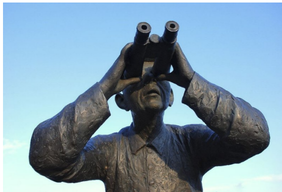
„Wenn der Zöllner mit dem Schmuggler ...“